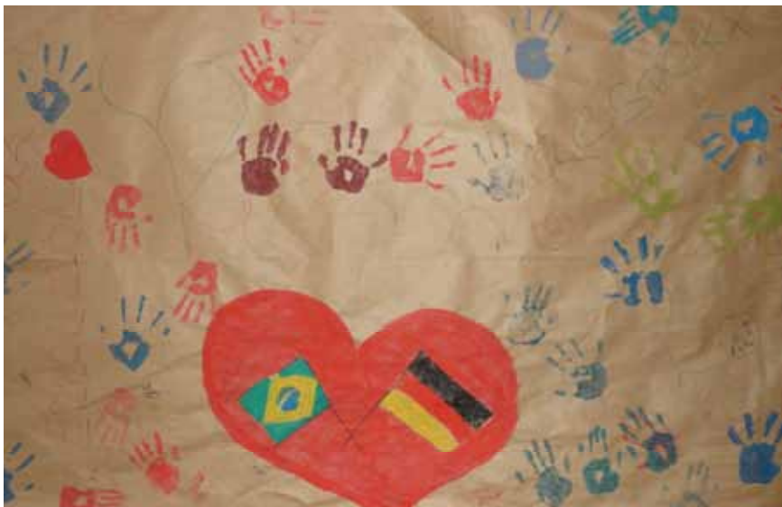
Liebe, Freundschaft, Achtung

Nach sechs Wochen ist die Zeit zu Ende, viel zu schnell, wie sie sagt, aber mit einer großartigen Erfahrung für sie und die Kinder. „Ich werde diese Zeit nie vergessen und sie hat meinen Wunsch gestärkt, nach dem Studium, in Brasilien zu leben und in der Entwicklungszusammenarbeit tätig zu werden.“